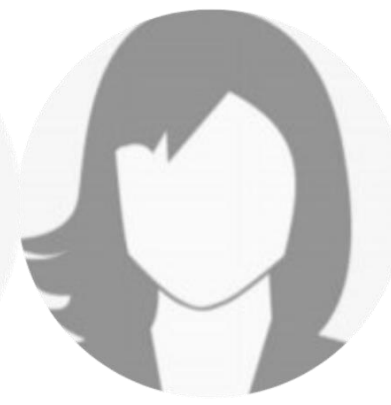
Vorname Name Schüler-Auslandskorres- pondent:innen Schule Stadt, Land