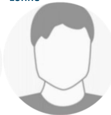
Vorname Name Schüler-Auslandskorres- pondent:innen Schule Stadt, Land