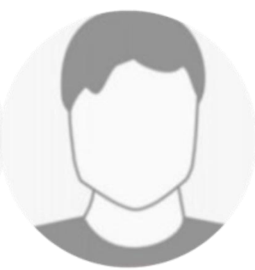
Vorname Name Schüler-Auslandskorres- pondent:innen Schule Stadt, Land