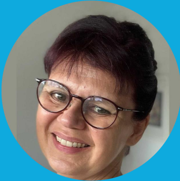
Dagmar Köhler Berufsbildende Schulen Burgdorf / Hannover

„ Eine große Bühne für großartige Ideen!