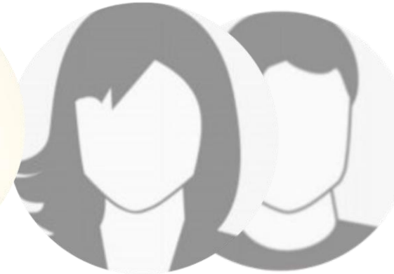
Vorname Name* Vertreter:in Robert-Enke-Stiftung Stadt