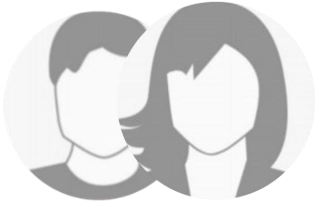
Vorname Name Schüler-Moderator:innen Schule Stadt