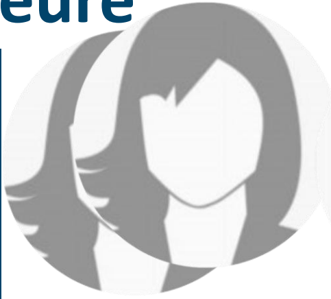
Vorname Name* Schüler-ReferentInnen Freiherr-vom-Stein- Berufskolleg Schulort Bad Oeynhausen