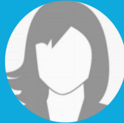
Vorname Name Förderer Stadt

„Wir initiieren und unterstützen den SchülerInnenZukunftsGipfel in Goslar, weil wir es wichtig finden, mit den Schüler:innen über ihre und unsere Verantwortung für die Zukunft unseres Planeten in Diskussion zu kommen. Dabei wollen wir nicht nur das Problem benennen, sondern vor allem auch aufzeigen, was die/der einzelne und was die Gemeinschaft jetzt und sofort tun müssen, um der jungen Generation und uns eine lebenswerte Zukunft zu ermöglichen. Den ersten Schüler:innenkongress zum Schwerpunktthema Recycling-Lösungen und Green Jobs im Kontext des Nachhaltigkeitsprinzips zu veranstalten, halten wir für ein wichtiges Signal.“