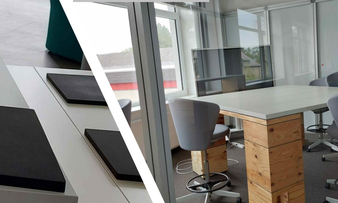
Dialog-Raum für die SchülerInnen-Presskonferenz