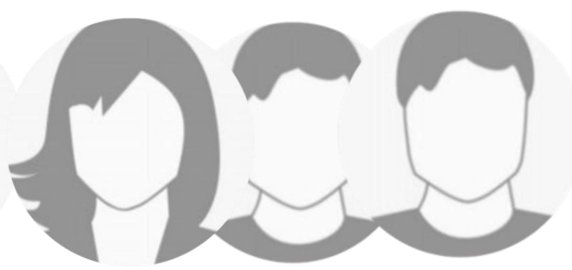
Vorname Name, Vorname Name* Schüler-Auslandskorrespondent:innen aus Jakarta und Santiago*