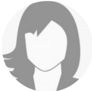
Cordula Häffner Medizinische Leiterin im Camp für Geflüchtet bei Ärzte ohne Grenzen Metche – Dafur im Tschad / Zentralafrika