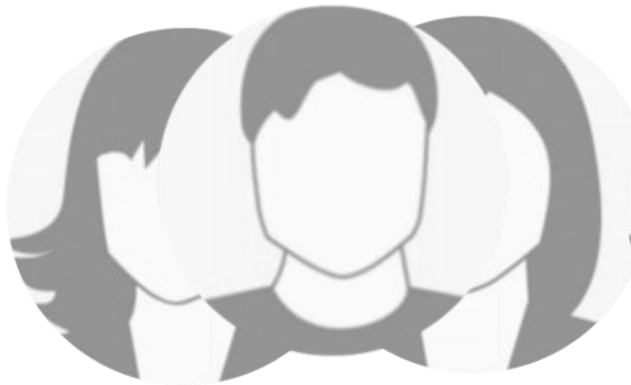
Vorname Name Schüler- Reporter:innen Max-Planck-Gymnasium Bielefeld